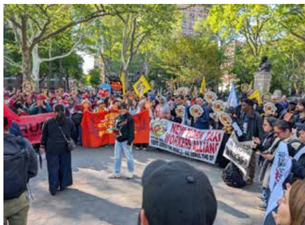
Le 1 er mai à New York

Le gouvernement a dû remballer son projet de loi qui remettait en cause ce droit pour les salarié-es des boulangeries-pâtisseries et des fleuristeries. L'intervention unitaire des 8 organisations syndicales (CFDT, CGT, FO, CFE-CGC, CFTC, UNSA, Solidaires et FSU) n'y est pas pour rien, dans une période où d'autres motifs de mécontentement peuvent provoquer une cristallisation revendicative.