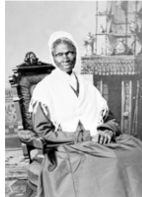
Sojourner Truth (1797-1883)

Je pense que ce Je émancipé est fondateur en quelque sorte d'une nouvelle société effectivement plus de type libertaire que de type communiste du moins comme les expériences de type totalitariste en Chine, en Russie ou ailleurs.