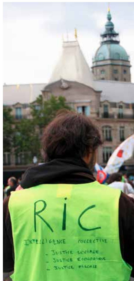
Douarnenez, Les sardinières

Je trouve intéressant de voir où passent les lignes de fracture par-delà des débats qui restent ouverts qui sont des débats importants, parce que ce ne sont pas seulement des débats théoriques.