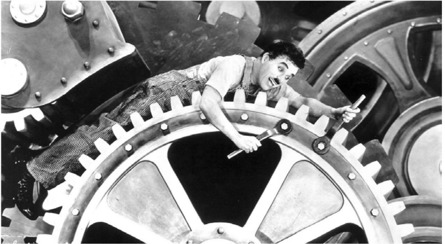
Les Temps modernes, Charlie Chaplin 1936