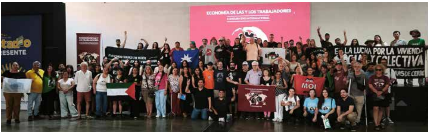
X e rencontre internationale de l'économie des travailleur-se-s

Si des initiatives comme les Rencontres internationales de l'économie des travailleurs et des travailleuses et le GSEF (forum mondial de l'économie sociale et solidaire) permettent à ses acteurs et actrices de se retrouver, de faire atelier ensemble, force est de reconnaître que leur mise en réseau, leur synergie au plan international, restent des objectifs à préciser et à réaliser.