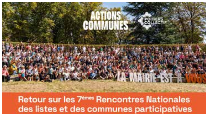
Retour sur les 7 èmes Rencontres Nationales des listes et des communes participatives