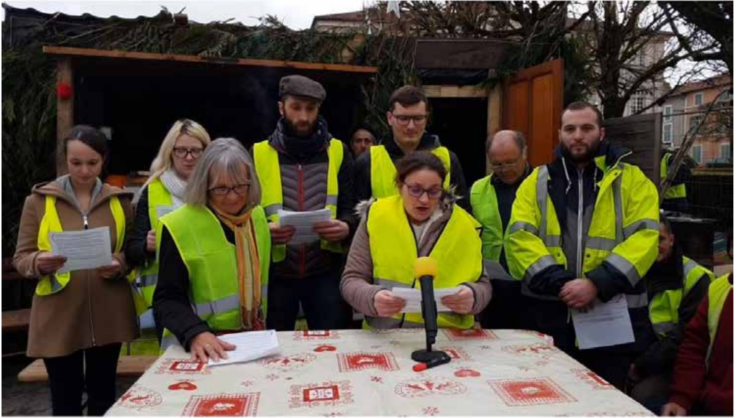
Appel de Commercy