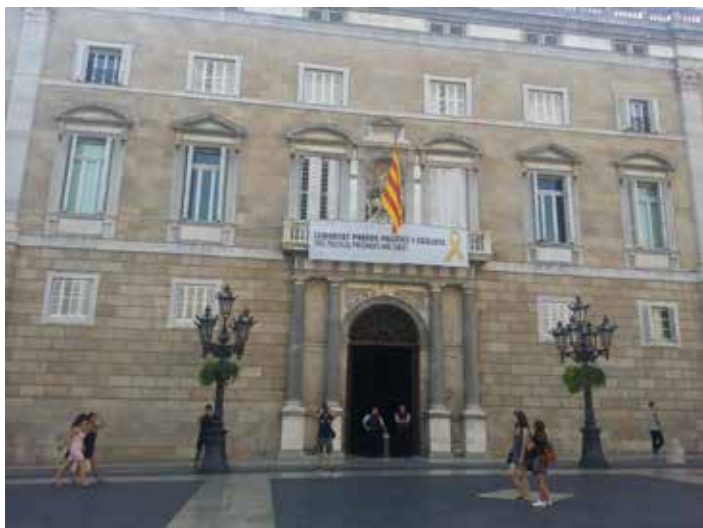
Barcelone Hotel de ville Août 2018

l'état et des différentes collectivités. Moi, je m'appuie sur mon expérience de maire. D'abord, nous avons créé des comités de quartier ouverts à la population. A partir de là il y a des partenariats à construire avec d'autres quartiers, d'autres communes, avec l'état, avec le monde économique. A partir d'espaces les plus ouverts possibles il s'agit de rattacher toutes les problématiques qu'on soulève, à l'ensemble des compétences, à l'ensemble des aspects de la vie. C'est ça qui permettra de créer cet écosystème politique, transformateur de la société. L'activité municipale peut aider à expérimenter cette démarche communaliste ».