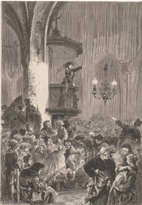
Une séance du Club des femmes