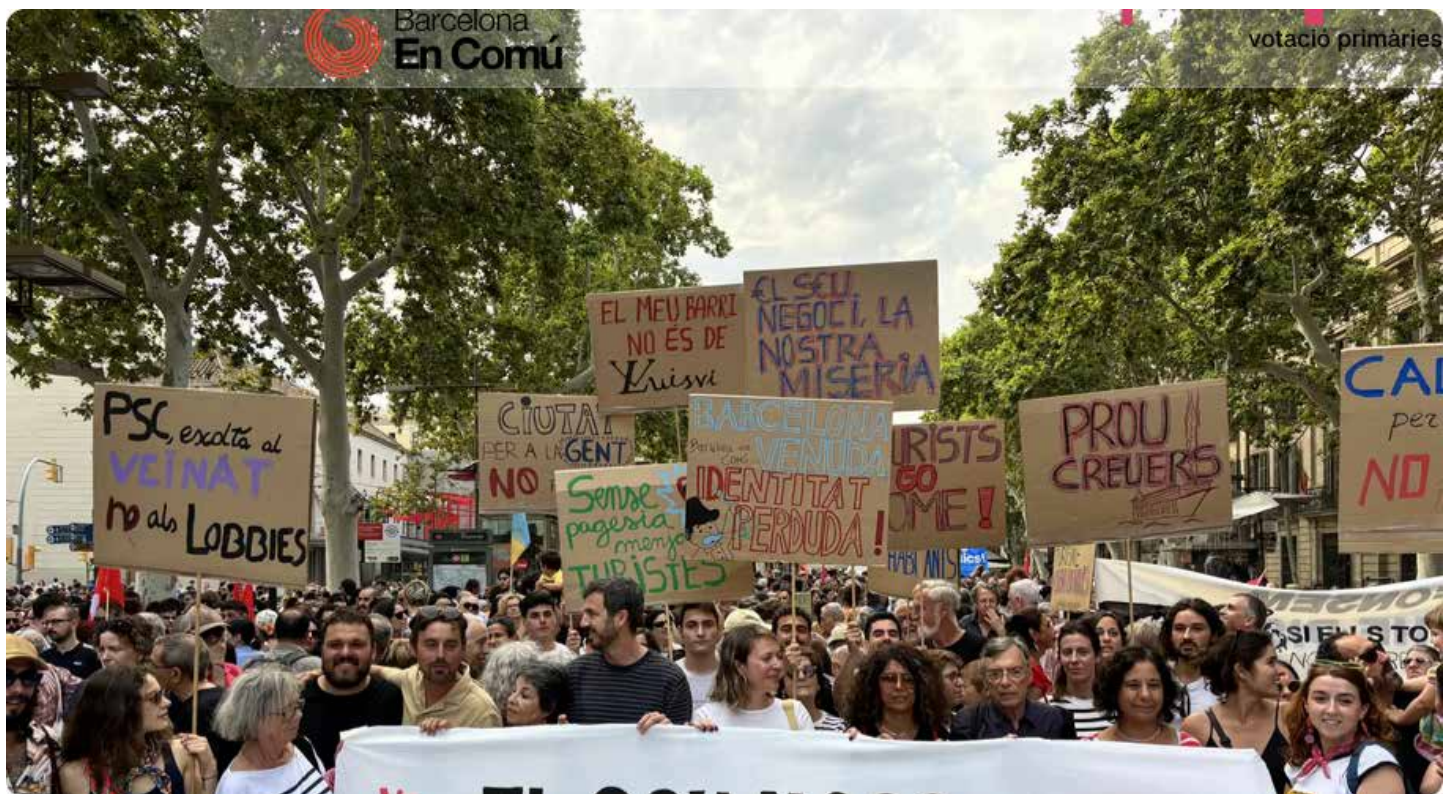
Barcelona En Comú