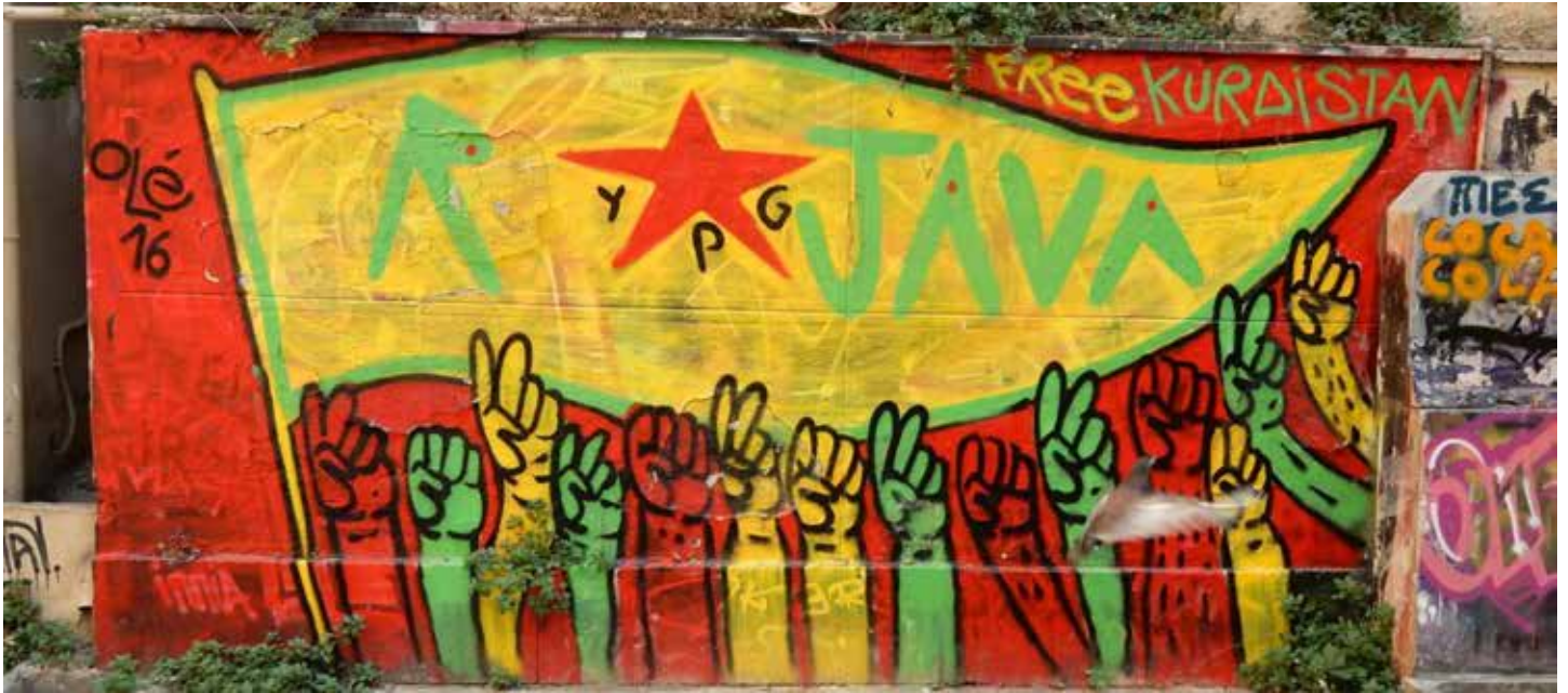
Au Rojava des communes de démocratie directe ont été mises en place