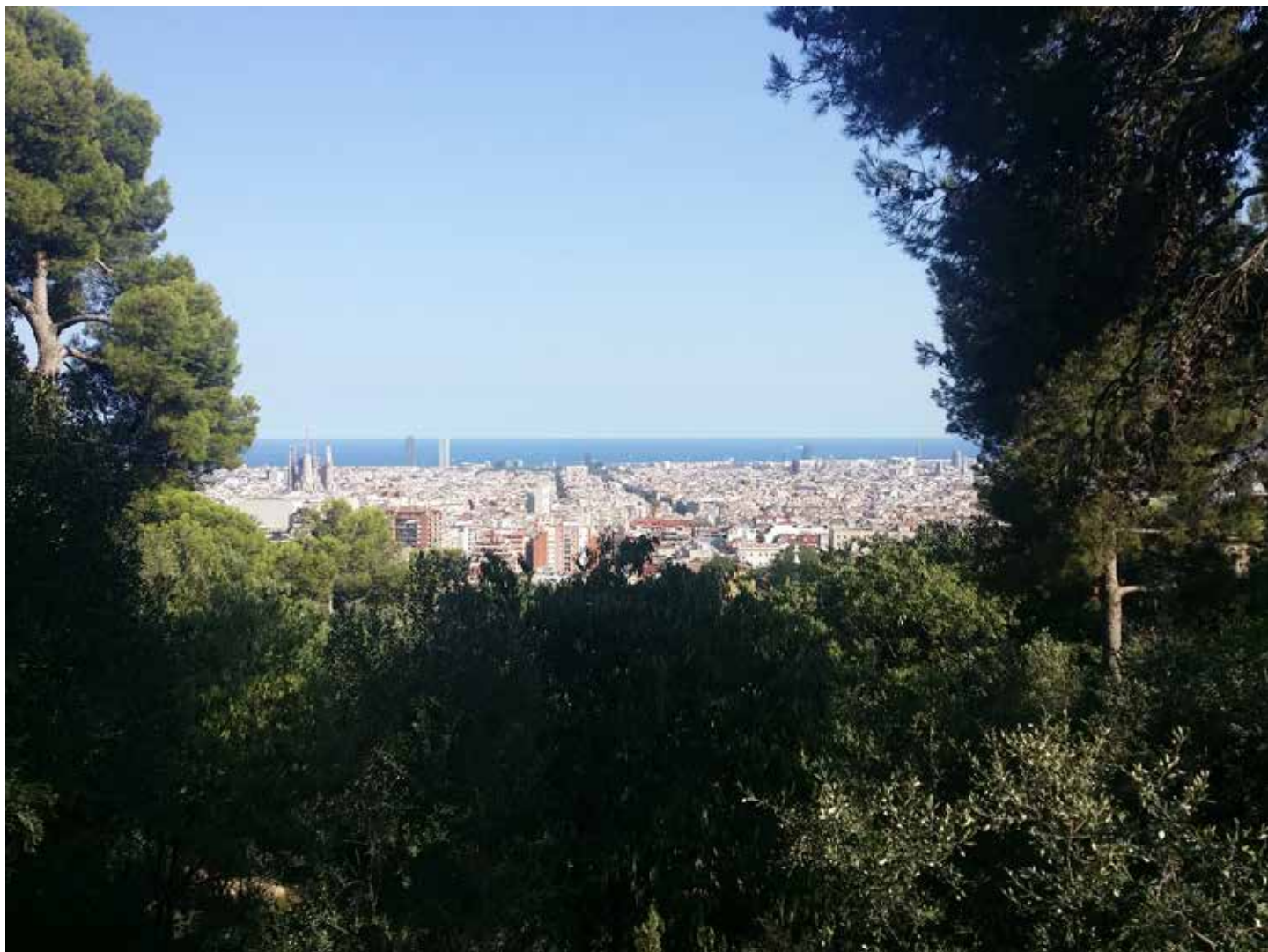
Barcelone Août 2018

soigner le cancer. Mais je suis comme citoyen capable de réagir si on me dit qu'on peut le soigner. J'interviens alors comme citoyen ; j'écoute ce que disent les spécialistes, mais je ne délègue pas le pouvoir de décider que, dans le budget général, il y a la lutte contre le cancer ».