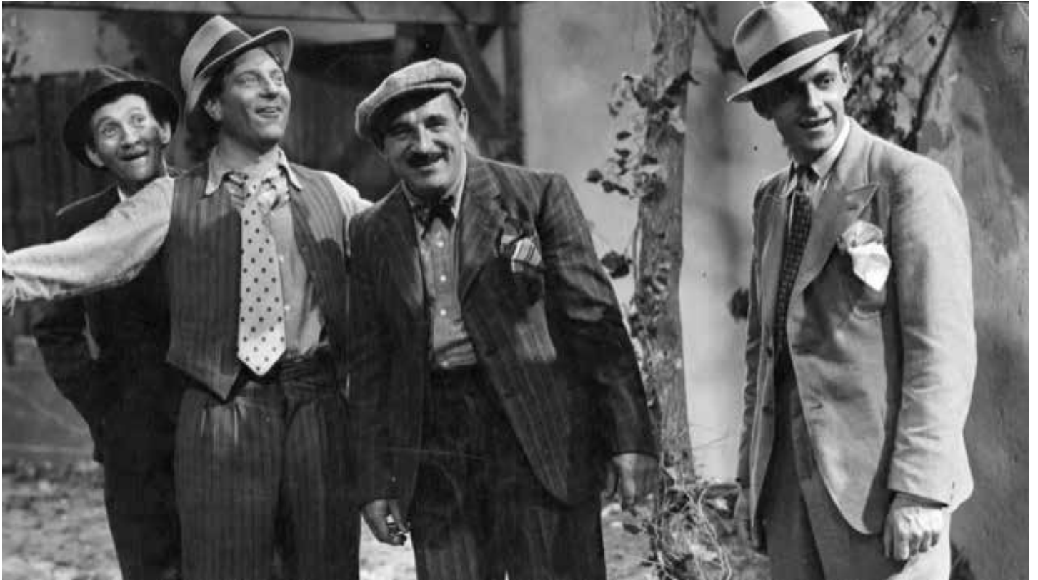
La belle équipe , Film réalisé par Julien Duvivier

À la fin des années 1930, cinq ouvriers parisiens Jean, Charles, Raymond, Jacques et Mario, réfugié espagnol menacé d'expulsion, souffrent du chômage et autres difficultés. Ils achètent ensemble un billet de la loterie nationale et gagnent le gros lot. Ils achètent ensemble une maison sur les bords de Marne pour la transformer en guinguette.