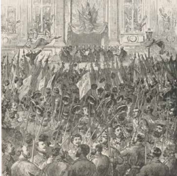
28 mars 1871 La Commune de Paris est proclamée

un régime qui dépossède la majeure partie de la population de la décision. Et donc ce qu'il s'agit de penser, c'est des institutions qui rendent ce pouvoir au peuple, qui rendent la capacité de décider à la population et l'assemblée populaire de démocratie directe a été conçue par les communalistes dans le but de permettre au peuple de se réapproprier le pouvoir. Il s'agit de remplacer le régime représentatif par un régime dans lequel on a des institutions de démocratie directe. Et cela a pas mal d'implication, notamment au niveau stratégique. Bookchin avance notamment l'idée qu'on peut attaquer les choses par les municipales. On va gagner les municipales et ensuite on va remplacer le conseil municipal par une assemblée populaire de démocratie directe pour montrer qu'on peut faire de la politique autrement que le peuple peut se réapproprier le pouvoir, en commençant par la commune. Si on a l'idée du communalisme comme quelque chose de social et politique, ce qui va être davantage déterminant c'est d'abord de construire la commune comme communauté de production et de consommation. Ça correspond plutôt aujourd'hui à l'idée des communs et à l'idée qu'il faut s'assembler pour trouver d'autres modes de solidarisation du travail et des fonctions économiques ».