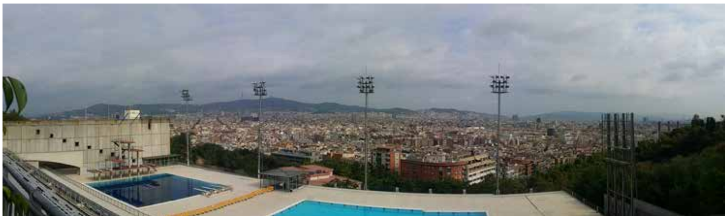
Barcelone Site Olympique Aout 2018

larise les lieux ». C'est une alternative à la « standardisation du monde. ».