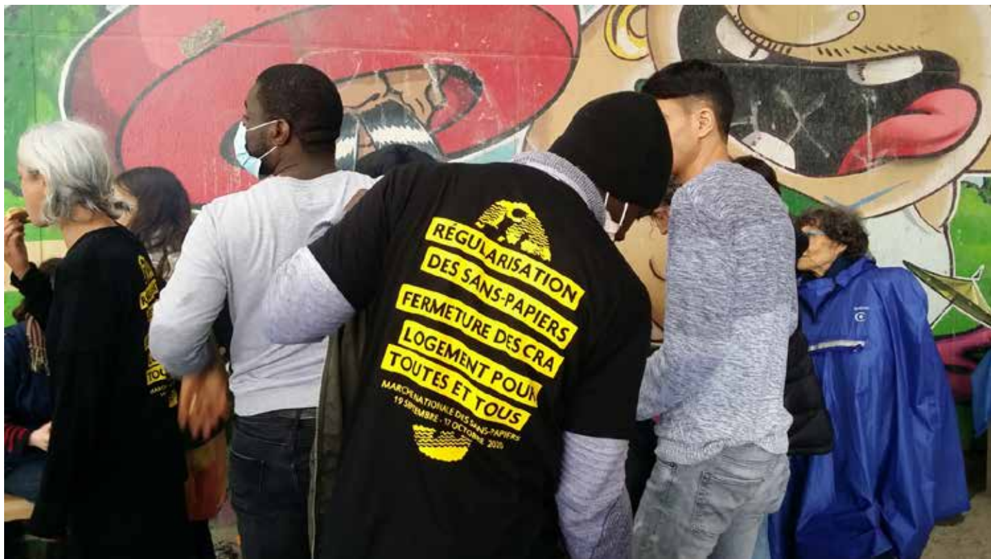
Logement Pour Toutes et tous