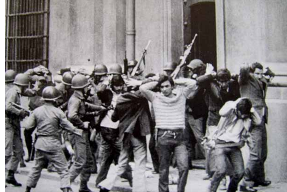
11 septembre 73, Chili

vernables en raison de la montée de l'égalitarisme et du désir de participation politique des plus pauvres. C'était là renouer avec une critique présente dès le Colloque Walter Lippmann de 1938 : l'emprise de l'opinion publique entrave l'action des experts. L'exemple du Chili, tout en étant unique, est très parlant : on y observe la conjonction d'une politique économique de privatisation tous azimuts et la mise en place d'une Constitution qui consacre le principe de la souveraineté de l'Etat en accordant la prééminence à une Cour constitutionnelle composée de juges et d'experts. Aussi n'est-il pas étonnant que le mouvement actuel au Chili mette au centre l'exigence d'une nouvelle Constitution : le slogan omniprésent « Là où le néolibéralisme est né, là il mourra », exprime la conscience du fait que c'est avec ce blocage politique et institutionnel du « pinochetisme sans Pinochet » qu'il faut rompre à présent. Si le néolibéralisme pousse toujours plus loin l'avantage, c'est parce qu'il a depuis le début le caractère d'une contre-révolution. C'est pourquoi il faut lutter pour une véritable rupture, au lieu de chercher à amender le système.