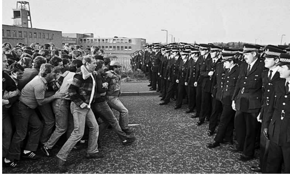
Grève des mineurs, Grande Bretagne, 1984