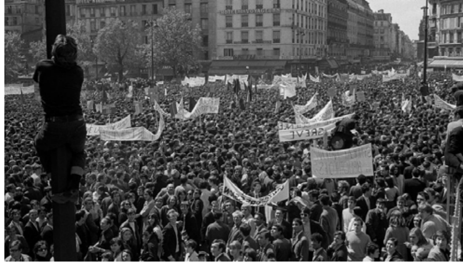
Mai 68 en France

durant toute cette période contre les classes populaires de par le monde.